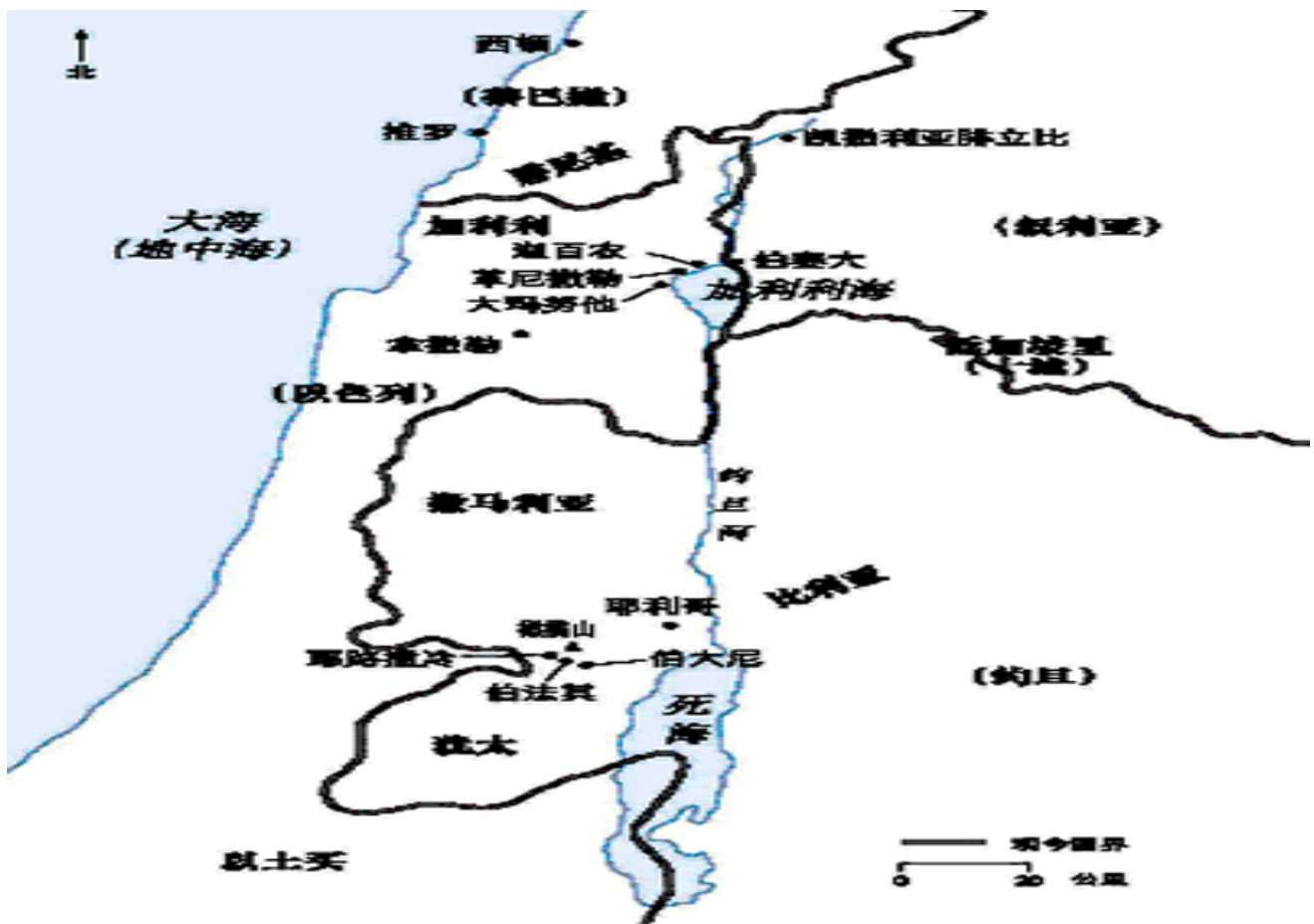
《马可福音第一章》——主职事的预备和开始

又在海边教训人(可四 1); 在「加利利海」东边的「格拉森」赶出污鬼(可五 8); 又回到「加利利海」西岸的「革尼撒勒」医治多人(可六 53); 又往「推罗」、「西顿」的境内去赶出迦南妇人女儿的鬼(可七 29); 又回到「加利利海」的东岸 (这地方称为「低加波利」) 医治耳聋舌结的人(可七 31); 又前往「伯赛大」开瞎子的眼(可八 22); 在「西泽利亚腓立比」激励门徒背起十字架来跟从祂(可八 34) ; 然后带着门徒上了高山(可能是「撒利亚腓立比」的境内的「黑门山」), 就在他们面前变了形像(九 2)。第十章发生的地点是在「犹太」, 主第三次向门徒提及祂的受死和复活, 然后前往「耶路撒冷」(可十 33)。第十一章记载主骑驴驹进「耶路撒冷」(可十一 7), 住宿「伯大尼」(可十一 11); 而后面对敌对人的质询(十一~十二章); 又预言要来的事(十三章); 最后祂受难, 完成了救赎的工作而死十字架上, 复活并升天(十四~十六章)。我们若查看地图, 就知主耶稣的行程, 相当的迂回曲折, 说出这位神的仆人, 无论祂是在屋子里, 在路上, 在海边, 在山上, 在旷野, 都殷勤的作工。