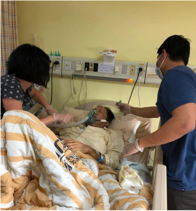
2. 我兒子和女兒在照顧我。2020 一月。