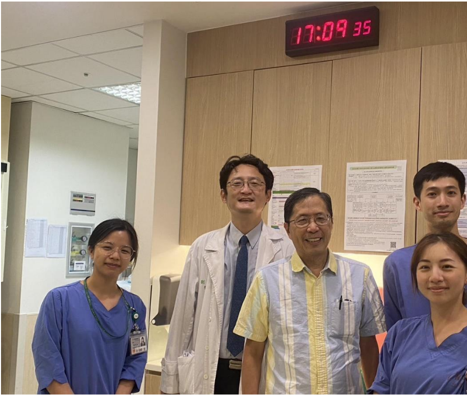
6. 與醫療團隊合影，2024 十月。

末了，我還想分享神的救恩在身體的醫治以外另一個層次的拯救，就是讓我借著翻譯一本有關信仰的書，不斷深刻的思考神為人預備的最終美麗榮耀的結局，就是主再來到地上要賜給那些忠心跟隨主的得勝的信徒一個榮耀的復活，帶著榮耀的身體，成為基督在祂的千年國度裡親密的同夥圈的一員，與祂一同治理那偉大的千年國度，其宏偉的程度要遠遠超越所有人類歷史上所建立的國度，不論在人數上，品質上和榮耀上都遠遠超越。這是神給人的最高獎賞，是值得我們今世去竭力追求的。